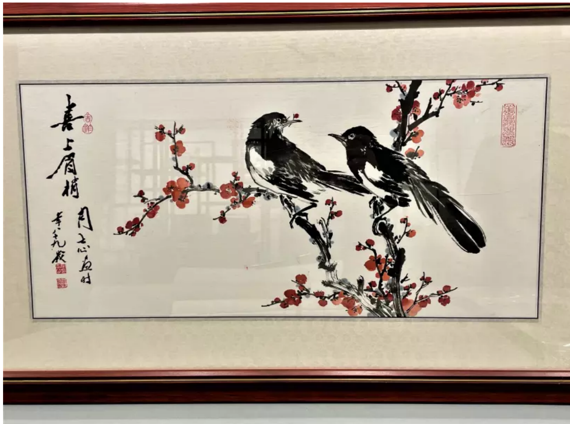
周士心-喜上眉梢 設色紙本 鏡面。