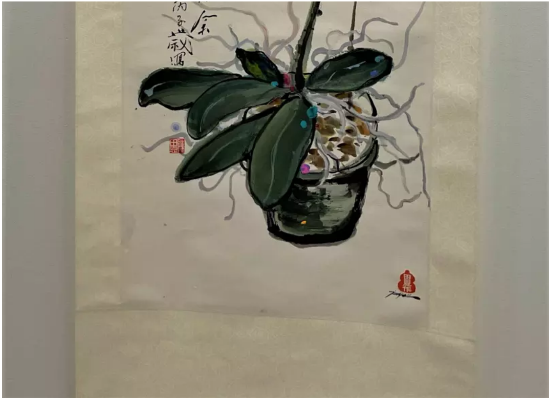
陳田恩-美不勝收 設色紙本 立軸。